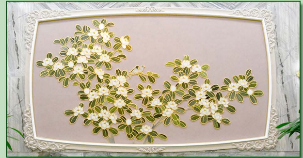
Magnolia motifs in architectural decoration Декоративные элементы с изображением магнолии.