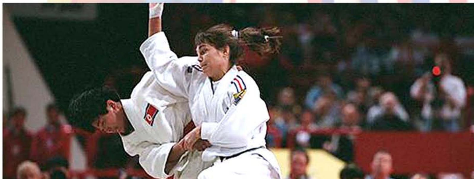
Первенство на чемпионате мира по женскому дзюдо в весовой категории до 52 кг. 90 г. чучхе (2001).