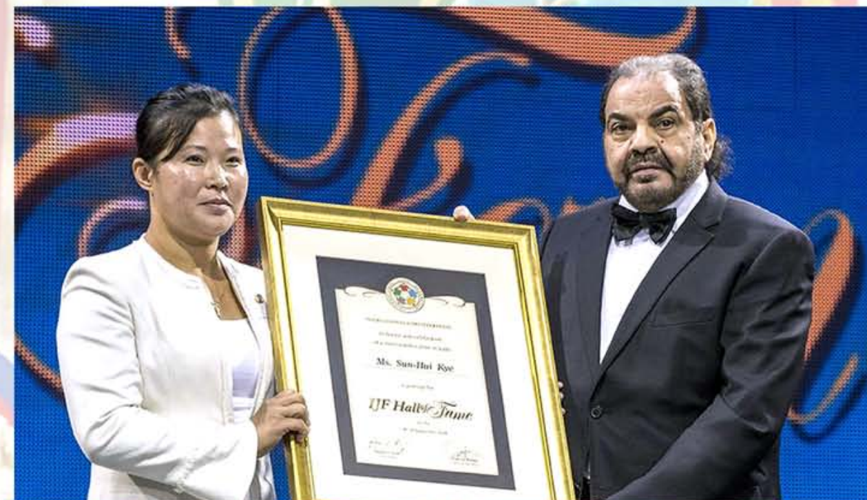
В 107 году чучхе (2018) Международная федерация дзюдо присвоила Ке Сун Хи премию в номинации «Знаменитая дзюдоистка мира».

теории до 52 кг, поднялась на пьедестал почета. И сегодня корейцы хорошо помнят ту девушку, которая, смотря на синий-красный флаг Республики, проливала горячие слезы.