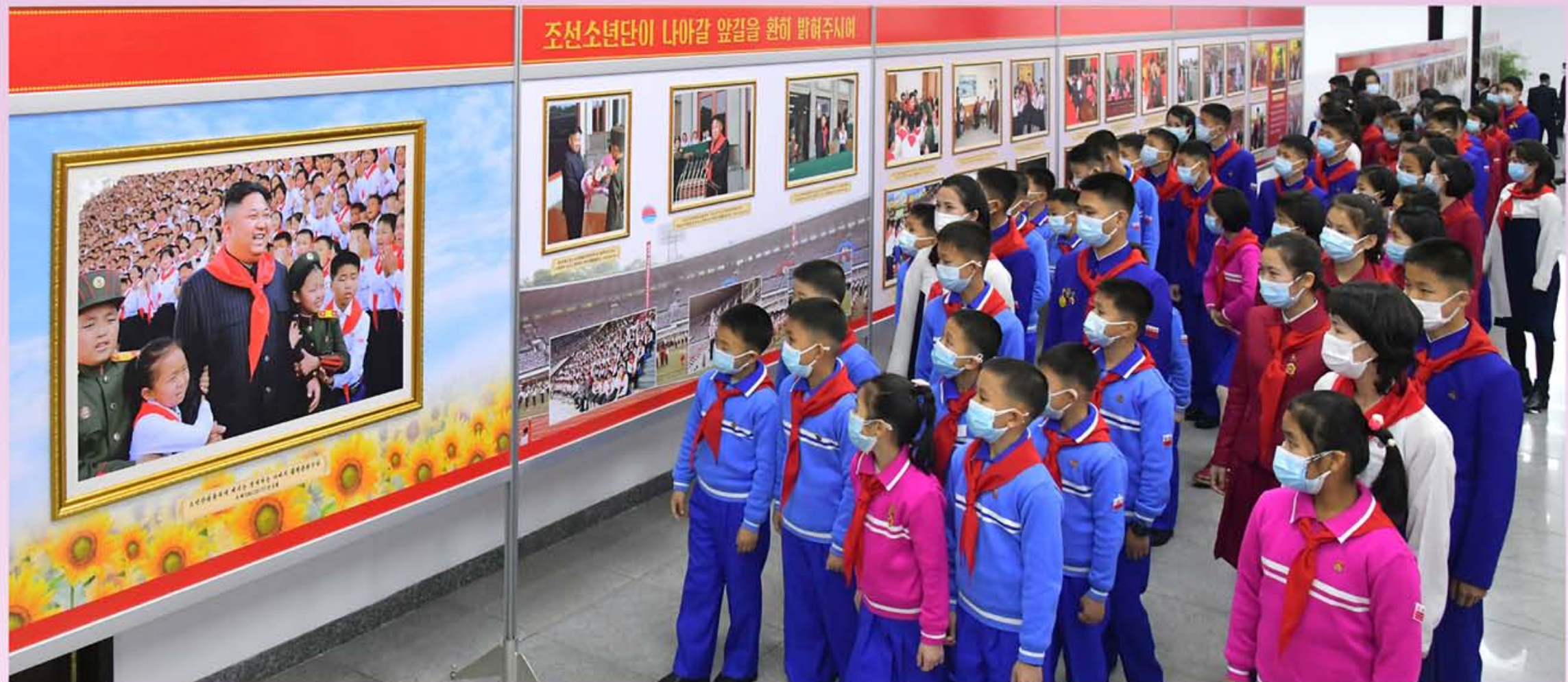
Фотовыставка в честь IX съезда Детского союза Кореи под названием «10 лет славы и счастья под лучами великого Солнца».

Выступающие выразили решимость хранить глубоко в сердцах большую любовь и доверие уважаемого Маршала-отца, который дорожит всеми детсоюзовцами страны, считая их радостью и гордостью, надеждой и будущим со-