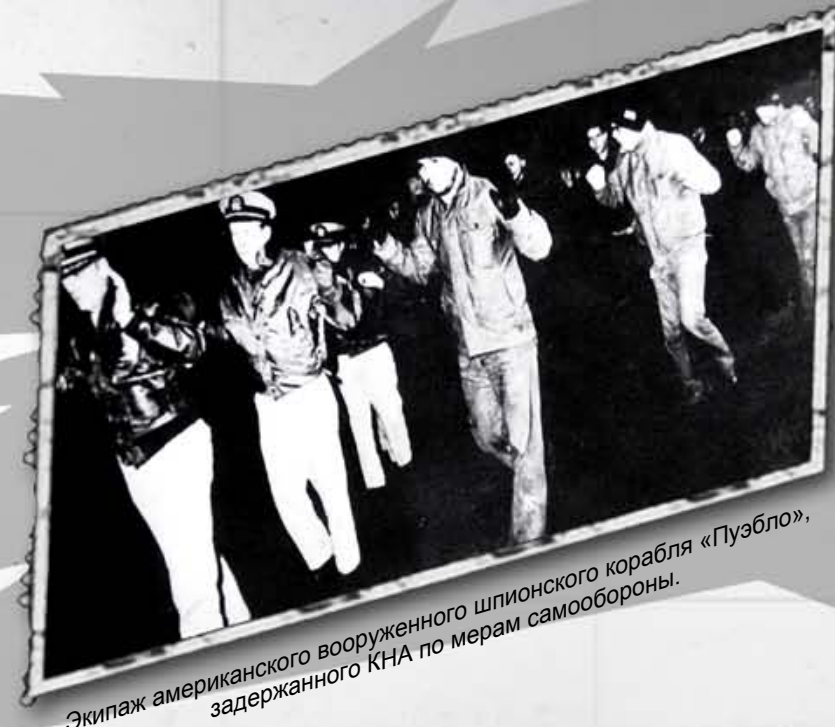
Экипаж американского вооруженного шпионского корабля «Пуэбло», задержанного КНА по мерам самообороны.

Военнослужащие КНА, безгранично воодушевленные стальной волей и решительной позицией, освещенными непобедимым стальным Полководцем Ким Ир Сенем, были полны решимости отразить агрессоров