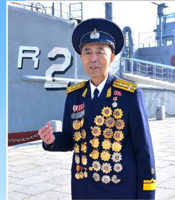
Экскурсовод Музея Победы в Отечественной освободительной войне, Герой КНДР Пак Ин Хо. К моменту задержания «Пуэбло» он был начальником поисковой группы катера военно-морского флота КНА.

Американский вооруженный шпионский корабль «Пуэбло». 23 января 1968 года он незаконно вторгся в территориальные воды КНДР и задержан моряками КНА.