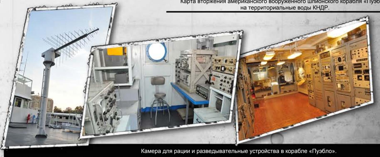
Камера для ради и разведывательные устройства в корабле «Пуэбло».