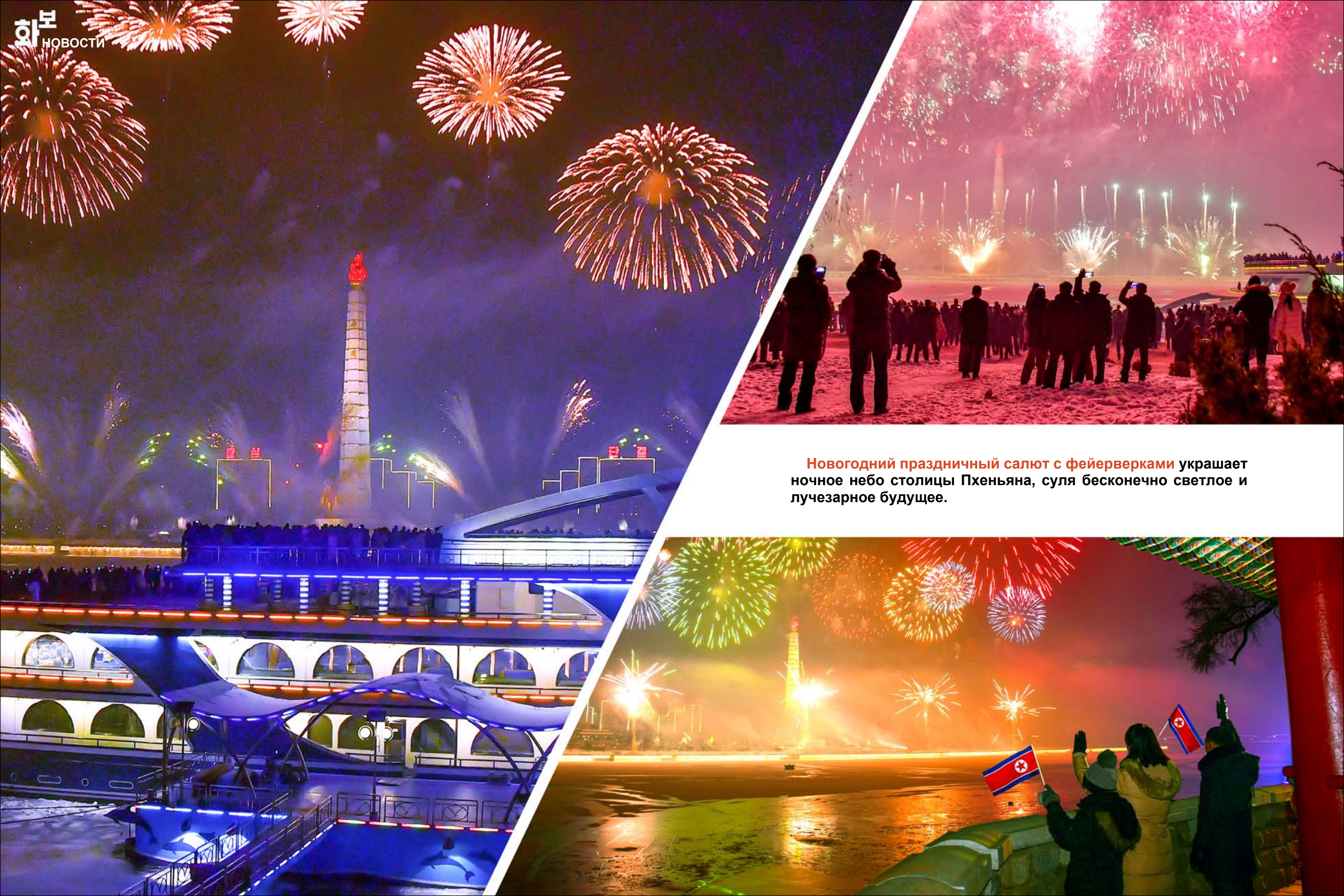
Новогодний праздничный салют с фейерверками украшает ночное небо столицы Пхеньяна, суля бесконечно светлое и лучезарное будущее.