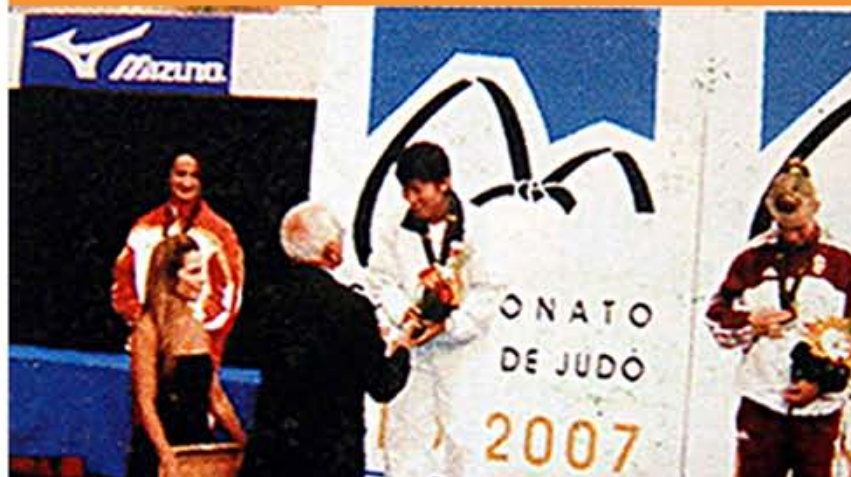
Первенство на чемпионате мира по женскому дзюдо в весовой категории до 57 кг. 96 г. чучхе (2007).