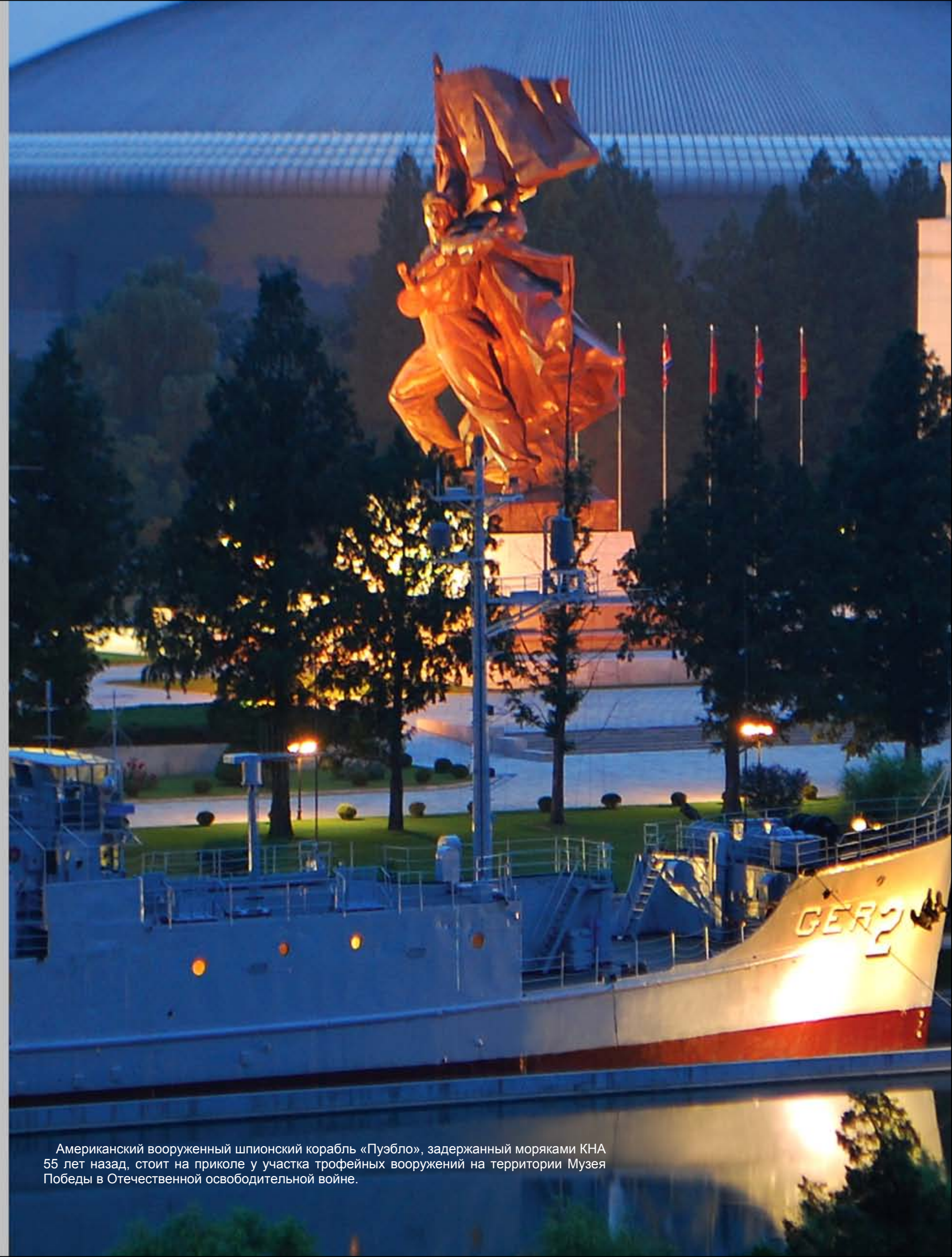
Американский вооруженный шпионский корабль «Пуэбло», задержанный моряками КНА 55 лет назад, стоит на приколе у участка трофейных вооружений на территории Музея Победы в Отечественной освободительной войне.