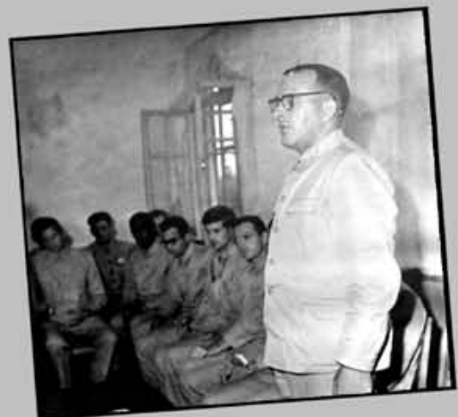
На пресс-конференции штурманский признает, что корабль «Пуэбло» вторгся в глубь территориальных вод КНДР.