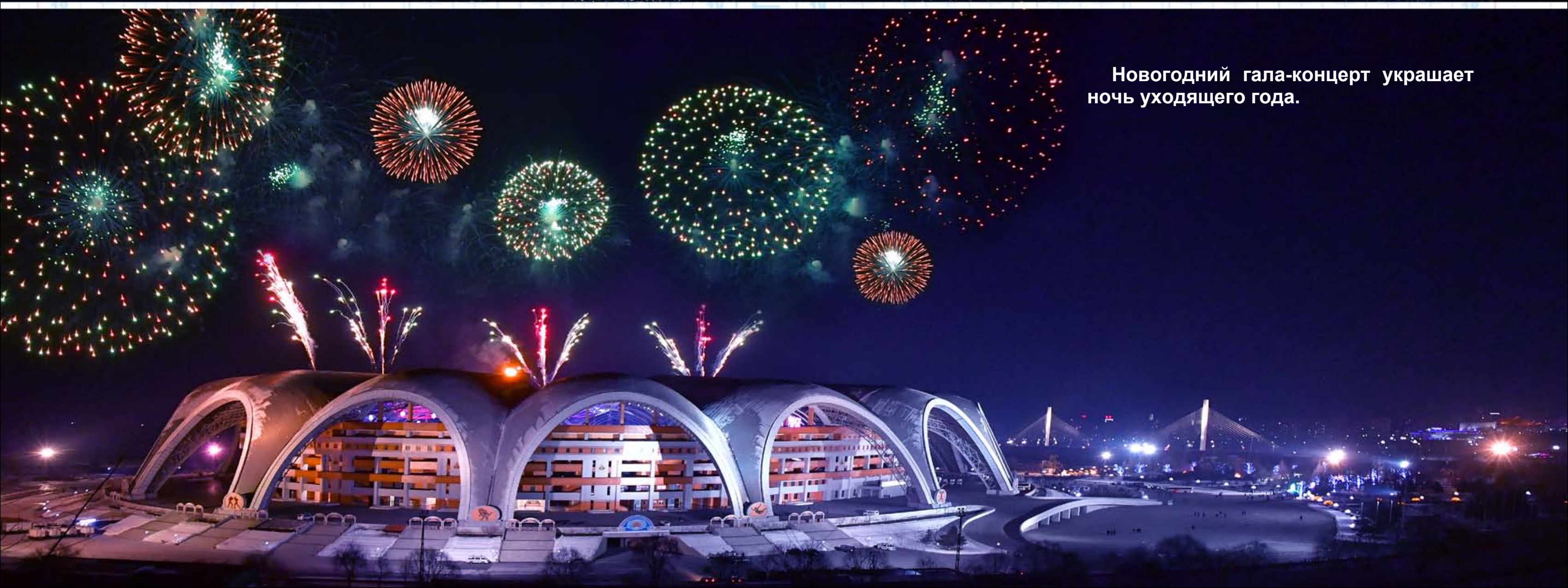
Новогодний гала-концерт украшает ночь уходящего года.