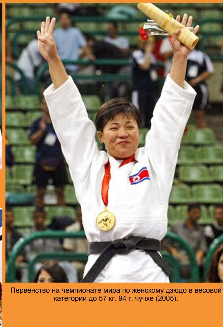
Первенство на чемпионате мира по женскому дзюдо в весовой категории до 57 кг. 94 г. чучхе (2005).