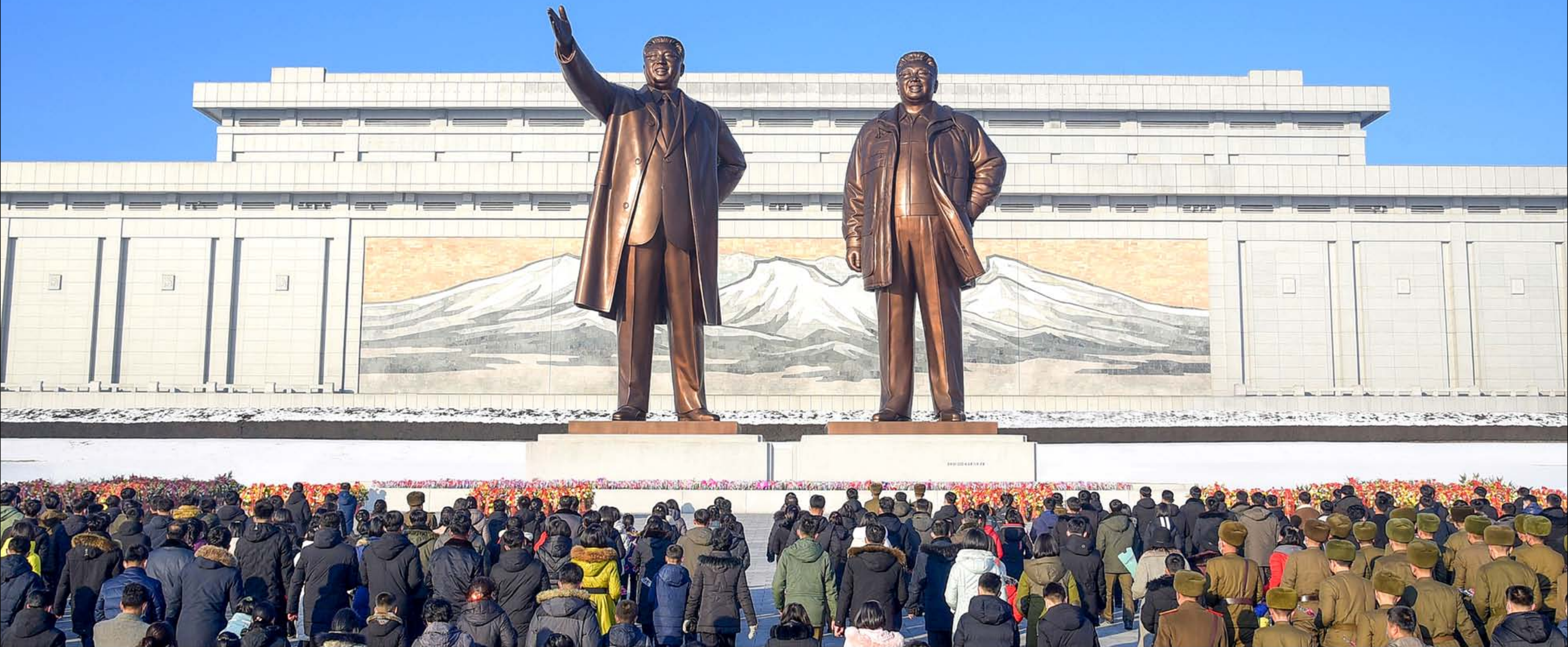
По случаю 112 года чучхе (2023) руководящие работники, трудящиеся, военнослужащие, молодежь и учащиеся возложили корзины и букеты цветов к бронзовым статуям великого вождя Ким Ир Сена и великого руководителя Ким Чен Ира на возвышенности Мансу.