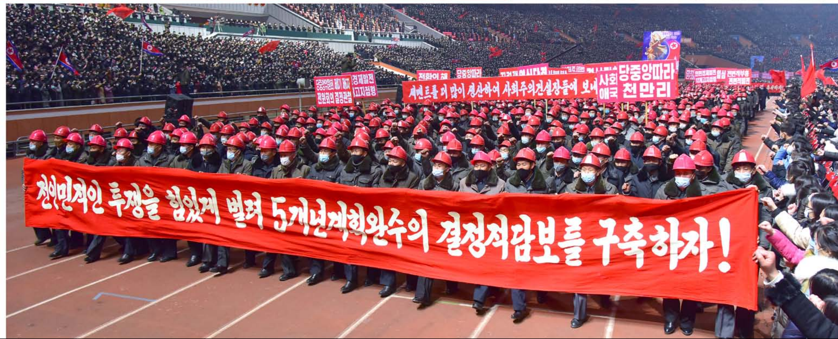
Участники массовой демонстрации ярко показывают убеждения и высокий дух непременно ускорить процесс прихода великой победы и славы грандиозной борьбой и созданием новых чудес.