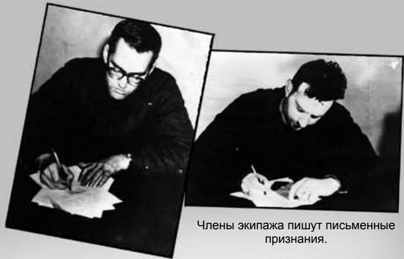
Члены экипажа пишут письменные признания.