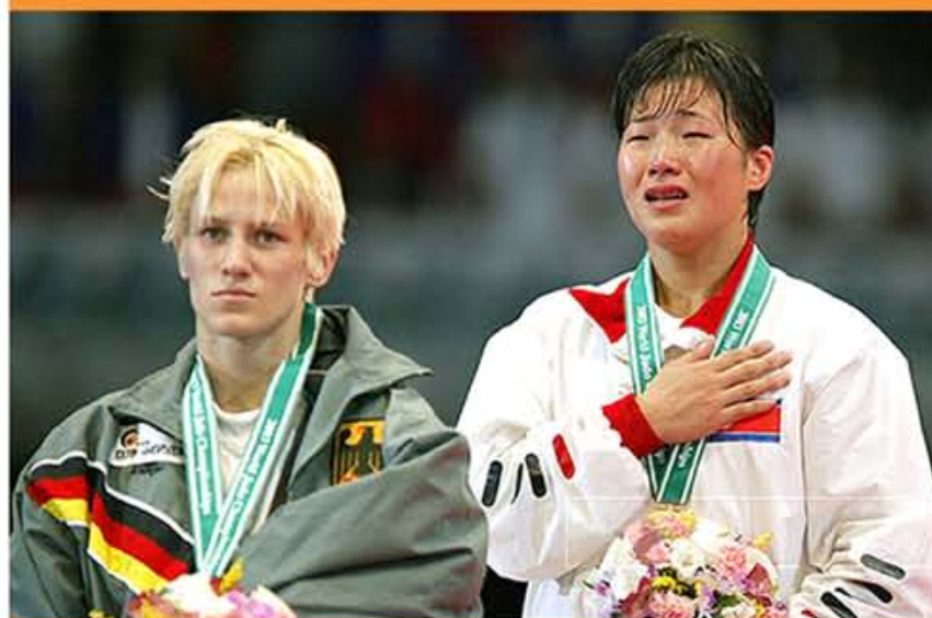
Первенство на чемпионате мира по женскому дзюдо в весовой категории до 57 кг. 92 г. чучхе (2003).