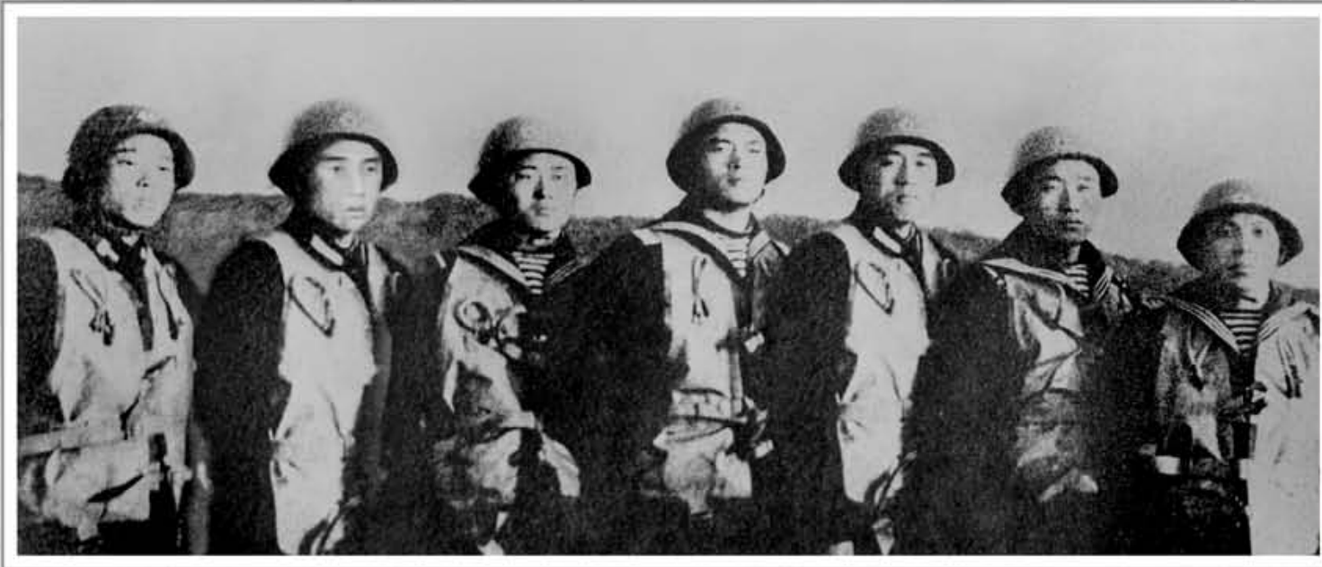
Моряки КНА задержали американский вооруженный шпионский корабль «Пуэбло».