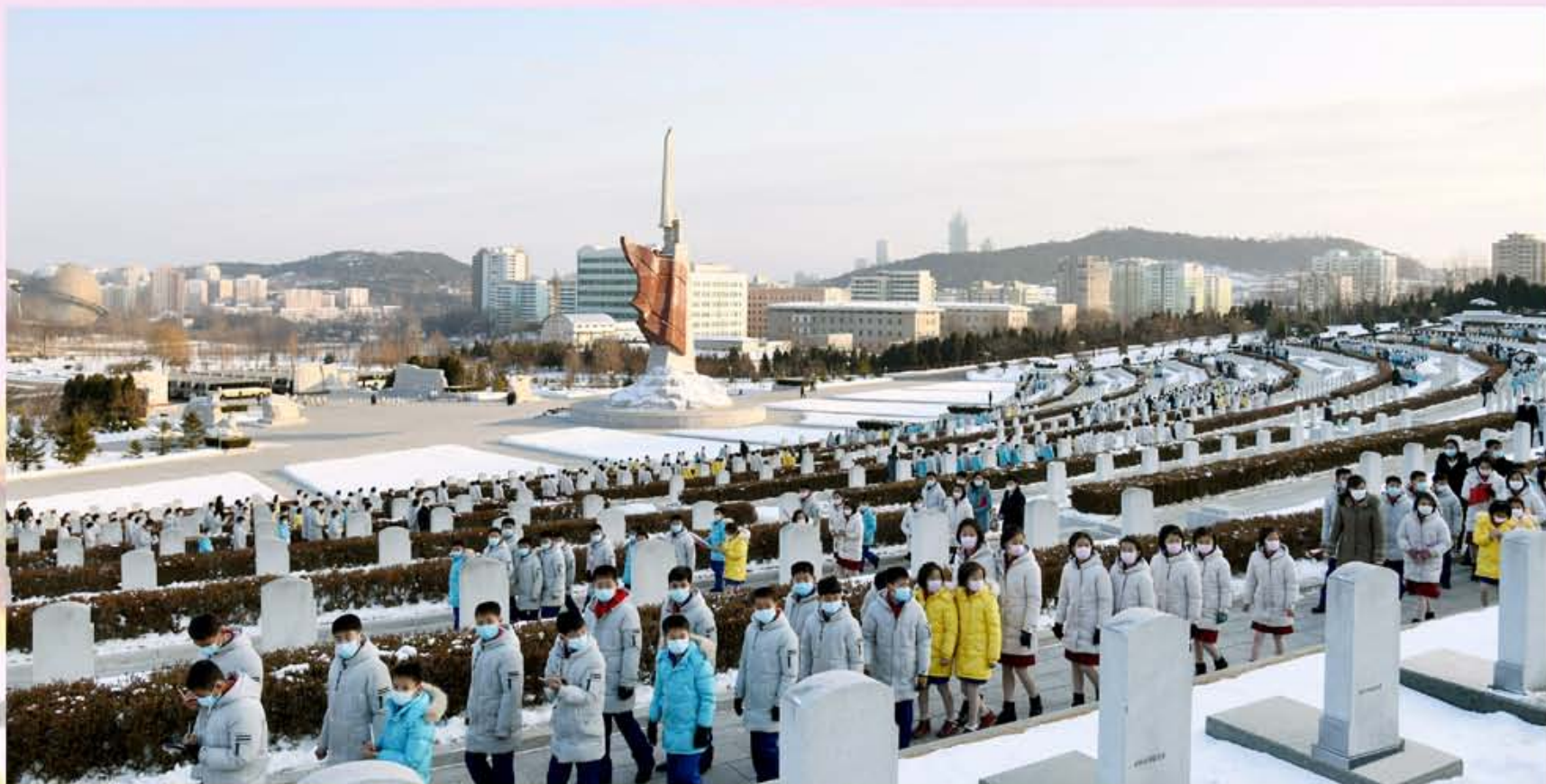
На Кладбище участников Отечественной освободительной войны и в Храме науки и техники.