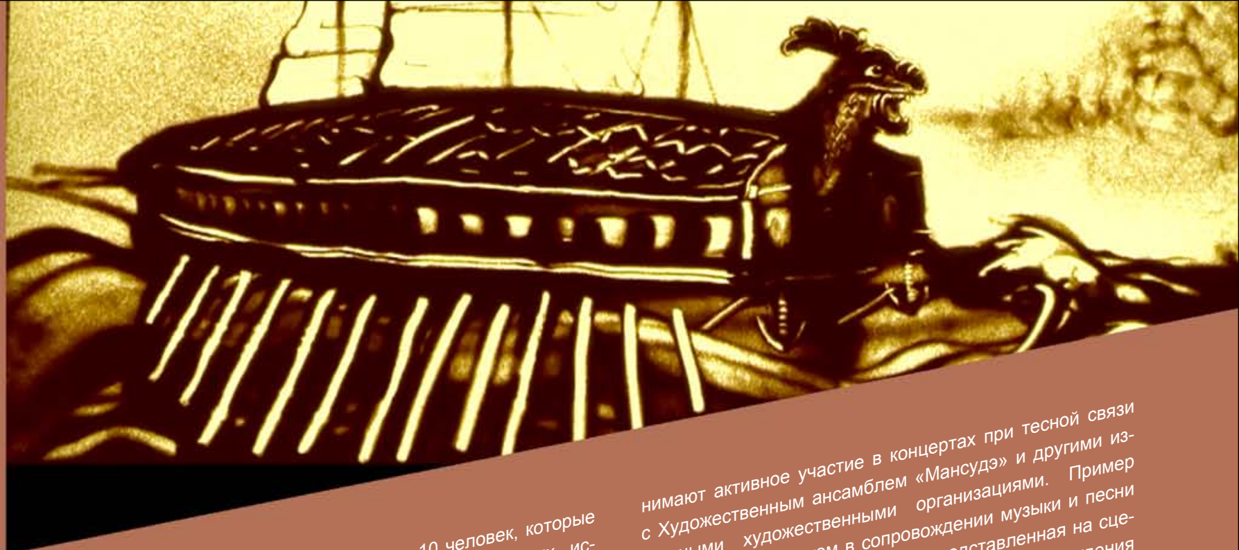
В Корее картина песком, являющаяся новым видом сценического искусства, поддерживает разные художественные представления. Она содержит темы познавательного и воспитательного значения и носит своеобразные характерные черты за применение разных технических приемов изобразительного искусства.

Сейчас в составе группы – более 10 человек, которые окончили Пхеньянский институт изобразительных искусств. Ныне художники, как и предшественники, достигают больших успехов в творческой работе. Они, прилагая большие усилия к коллективному созданию произведений, всегда стараются расширять их сюжеты и образы. Как они сами признаются, в ходе этого коллектив объединяется в одно целое умом и душой, и товарищеские узы становятся куда прочнее. Для создания лучших произведений художники при-