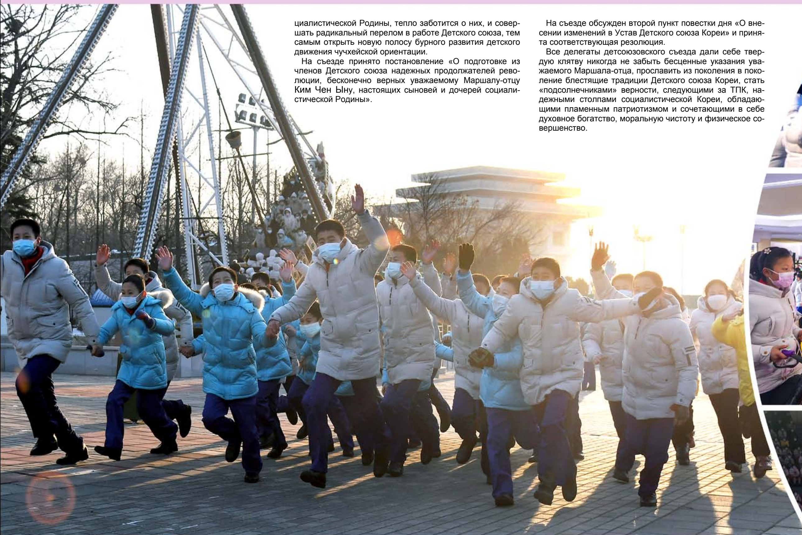
Участники детсоюзовского съезда проводят радостные и веселые дни, которые будут незабываемыми в жизни.

Все делегаты детсоюзовского съезда дали себе твердую клятву никогда не забыть бесценные указания уважаемого Маршала-отца, прославить из поколения в поколение блестящие традиции Детского союза Кореи, стать «подсолнечниками» верности, следующими за ТПК, надежными столпами социалистической Кореи, обладающими пламенным патриотизмом и сочетающими в себе духовное богатство, моральную чистоту и физическое совершенство.