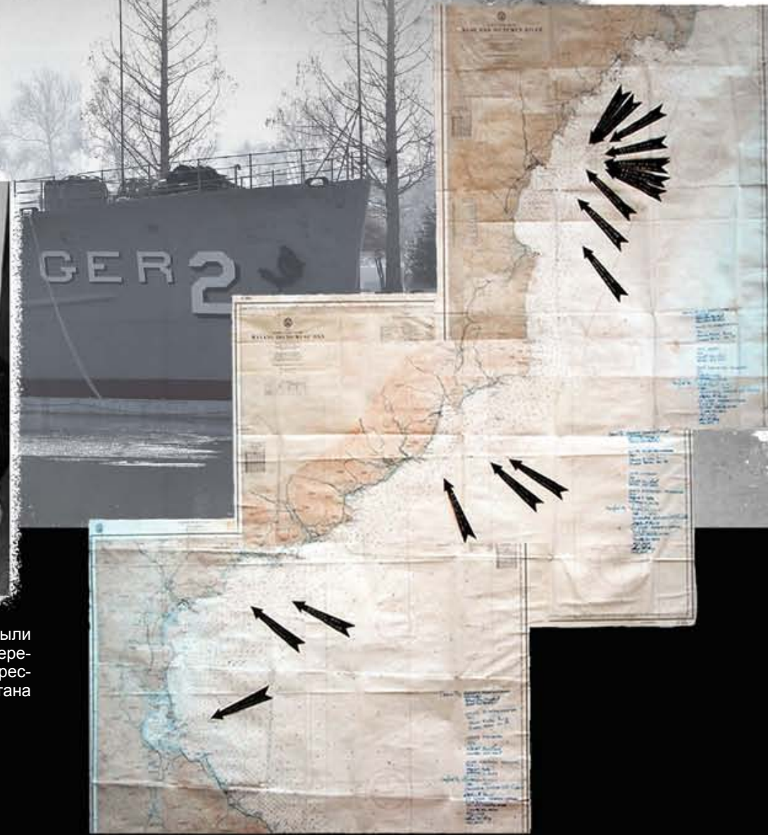
Карта вторжения американского вооруженного шпионского корабля «Пуэбло» на территориальные воды КНДР.

«По правде говоря, наши акции были преступлением против Соглашения о перемирии в Коре. Это совершенно была агрессия». (Из письменного признания капитана корабля «Пуэбло»).